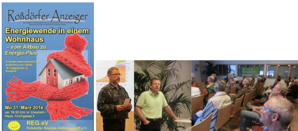
Vortragsveranstaltung zu „Energiewende in Roßdorf“