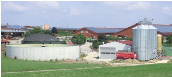
Karlshof mit Biogasanlage